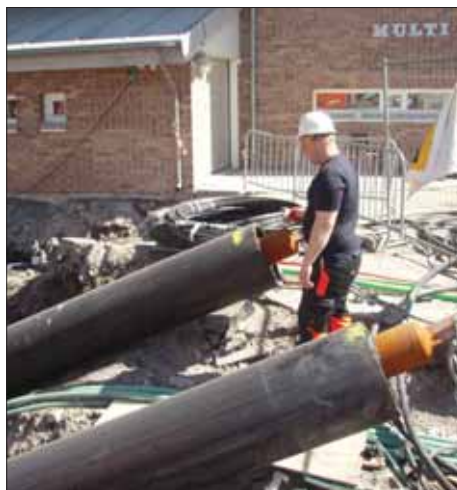
Rørene under Vesterelva er på plass.