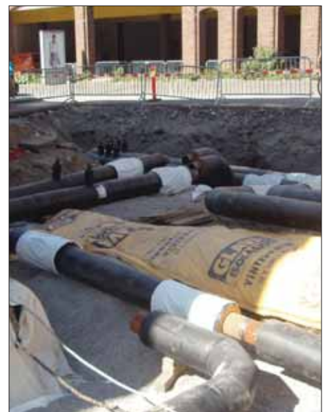
Avgrening fra Farmannsgate mot elvekryssingen til Værste.

Fredrikstad den 30. april 2009 Per Bolstad / Adm. direktør