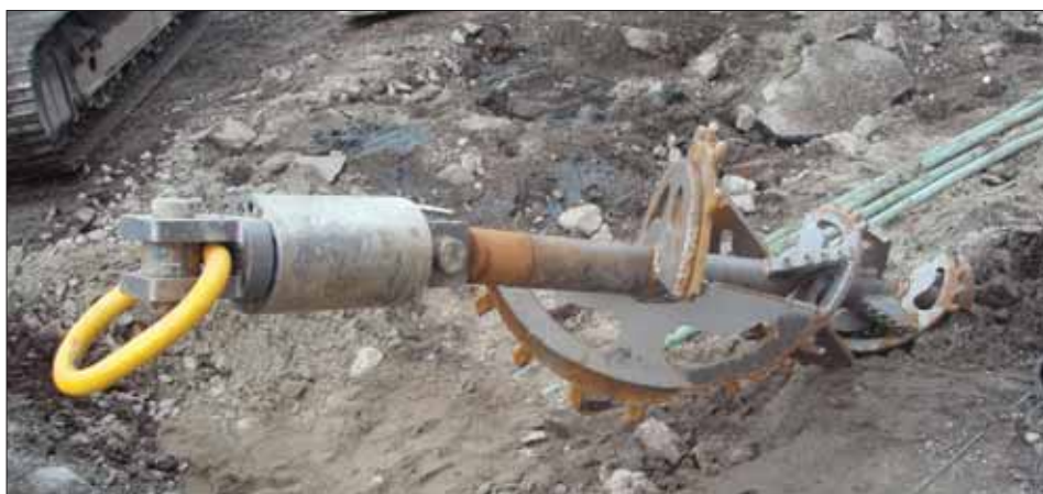
Rymmeverktøy brukt ved den styrte boringen under Vesterelva.

I samsvar med regnskapsloven bekreftes det at forutsetningen om fortsatt drift er lagt til grunn ved avleggelsen av årsregnskapet. Dette er begrunnet i de forutsetninger og planer som er lagt. Videre er det begrunnet i at utbyggingen av fjernvarmenettet er under gjennomføring, samt at finansieringen av den videre utbyggingen av nettet er i orden. Eiernes langsiktige hensikter og strategier er også lagt til grunn for denne forutsetning.