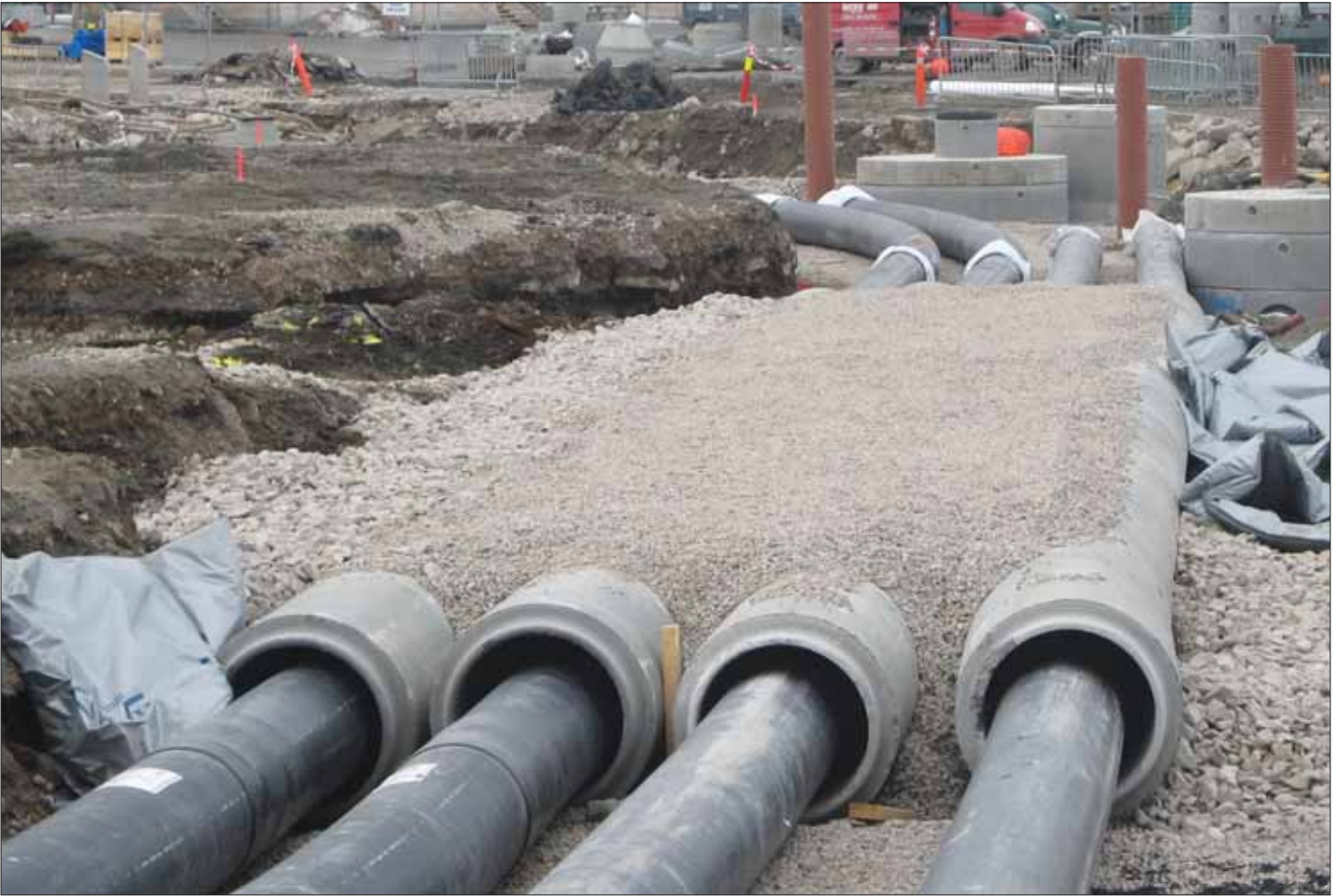
Kryssing av RV 108 med fjernvarme og fjernkølerør. Rørene er lagt i trekkerør av betong.

boligbyggingen. Her er det planlagt å bygge inntil 1600 leiligheter. Det er nå vedtatt å bygge en ny skole og flerbruks-hall helt syd på Sorgenfriområdet. Skolen vil stå klar i 2011. Det er også konkrete planer om å bygge et nytt bydelssenter med til sammen ca. 10.000 kvm. næringsareal, primært ment for handel.