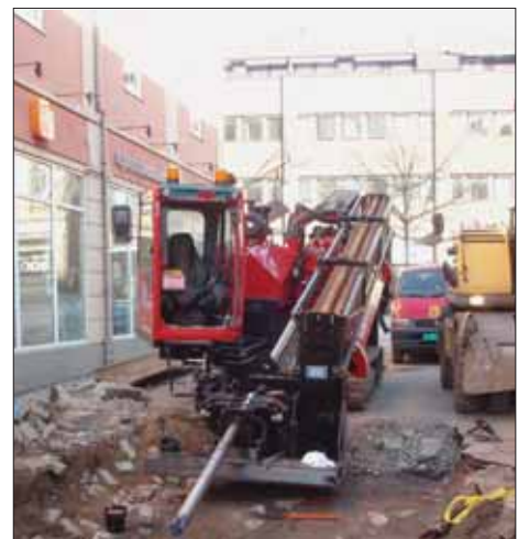
Styrt boring under Vesterelva. Bildet er fra St. Hans gata.