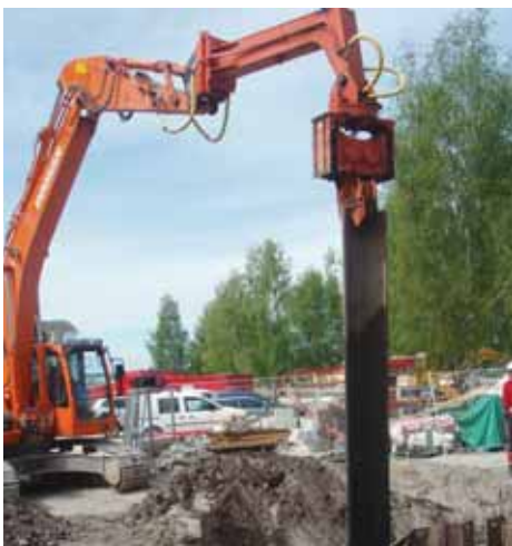
Dårlige grunnforhold med mye leire, gjør at det ofte må brukes spunt for at grøftene ikke skal rase sammen.