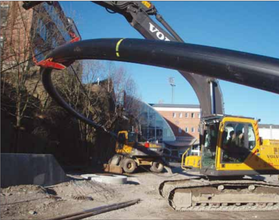
Trekking av trekkerør for fjernvarmerør under Vesterelva.

Fordeling pr. energibærer for produksjon av fjernvarme i 2008 er slik: