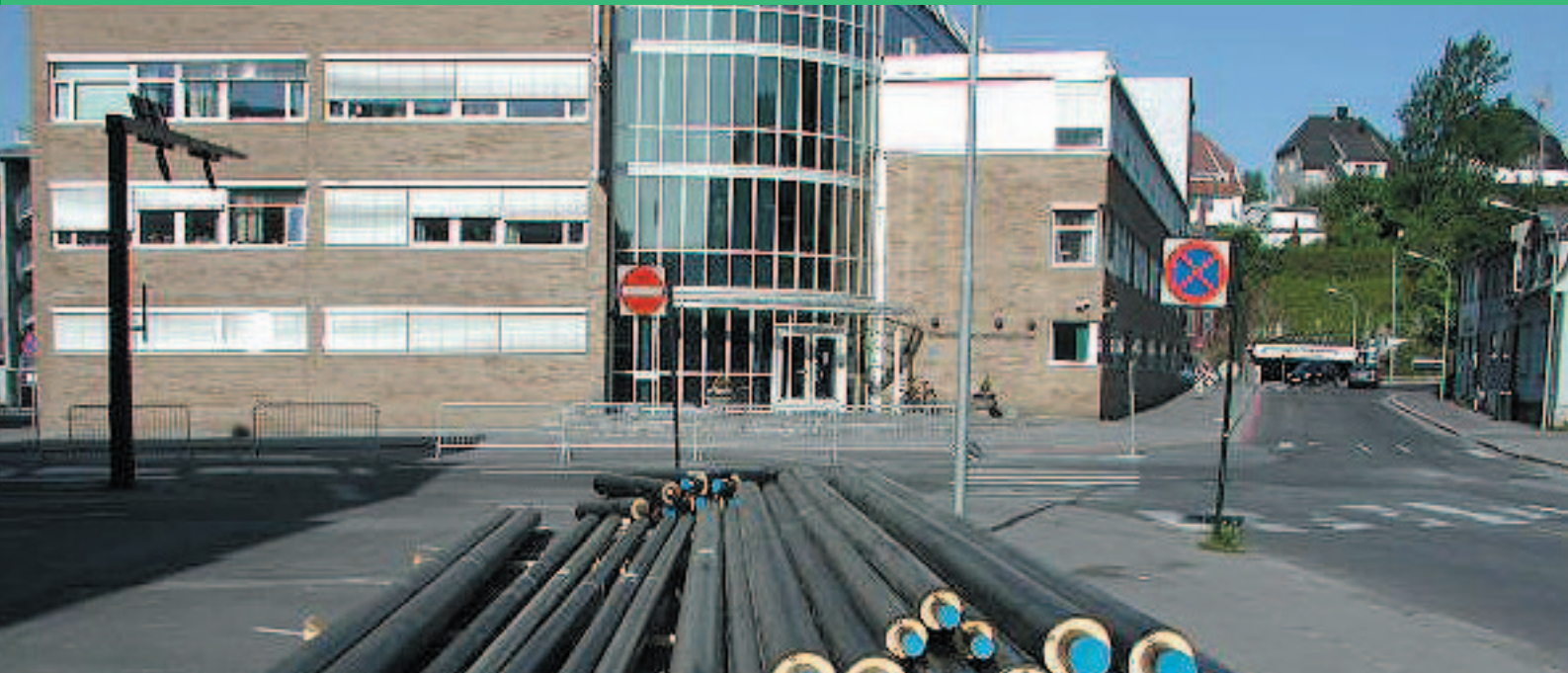
Politihuset i Fredrikstad