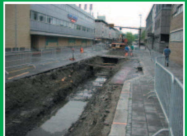
Gunnar Nilsens gate ved Torvbyen